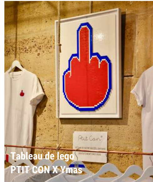
Tableau de lego PTIT CON X Ymas