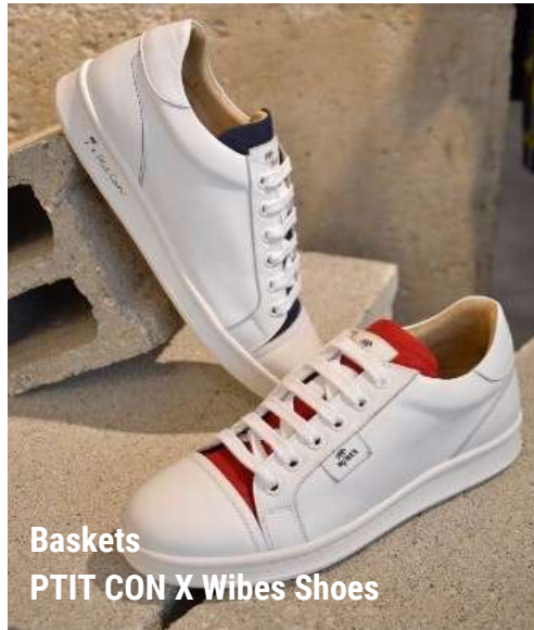
Baskets PTIT CON X Wibes Shoes