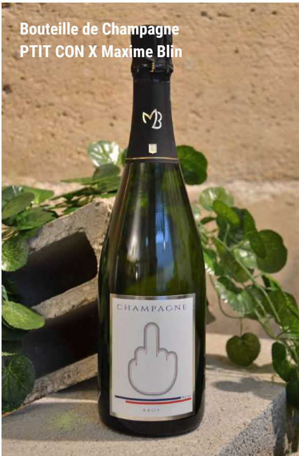
Bouteille de Champagne PTIT CON X Maxime Blin